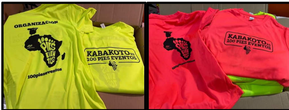
Camisetas de los organizadores en amarillo y color coral para los niños de la carrera 2026.

Las bolsas del corredor llevan, agua, fruta, gominolas, chocolatina, cereales, camiseta de atletismo, además de regalos sorpresas (balones, muñecos, zapatillas, etc).