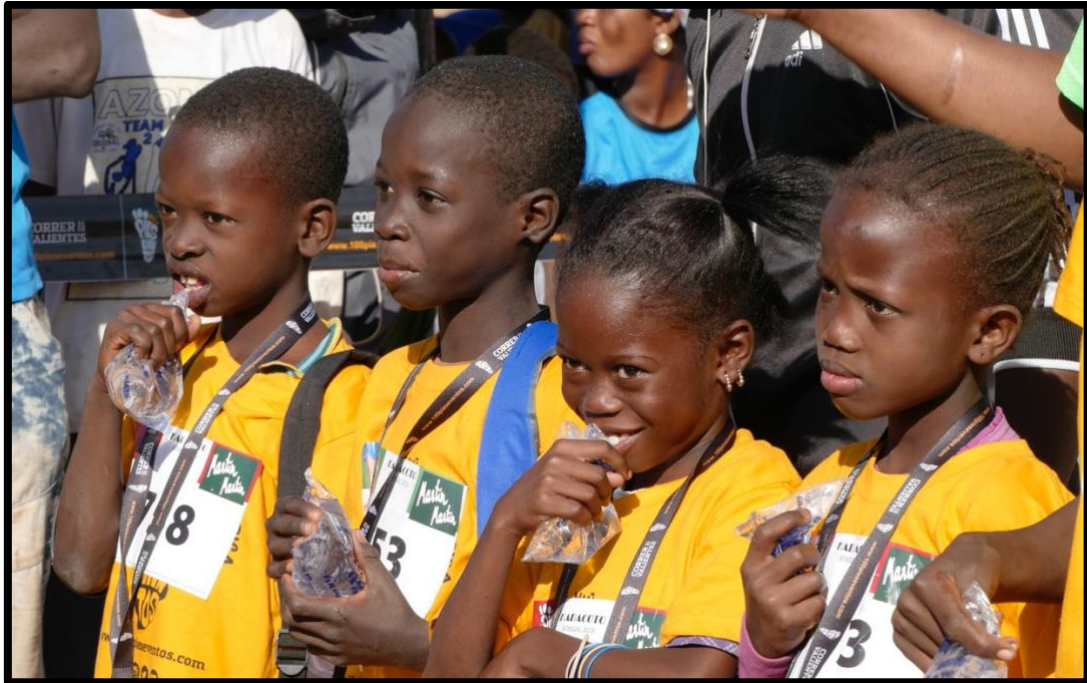
Ganadores de una de las carreras.

Las carreras se realizan por tandas y cursos escolares , donde todos corren con dorsal, camiseta de la carrera y reciben una bolsa del corredor en meta. Además, se entrega medalla y regalos a los 3 primeros/as de cada tanda .