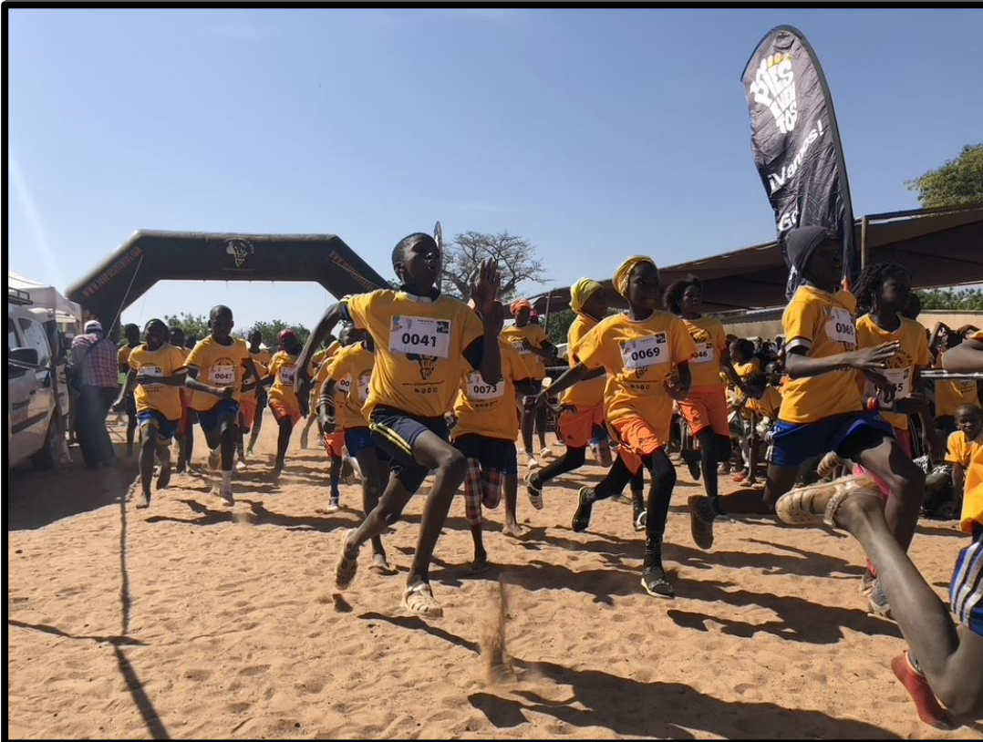
Momentos de las carreras infantiles.